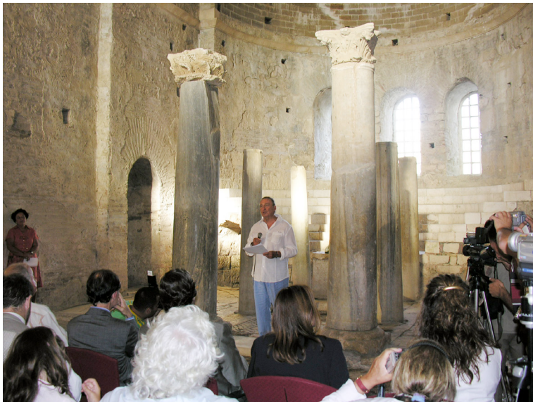
Mr. Rahmi Koc, Honorary President of Koc Foundation, making his speech