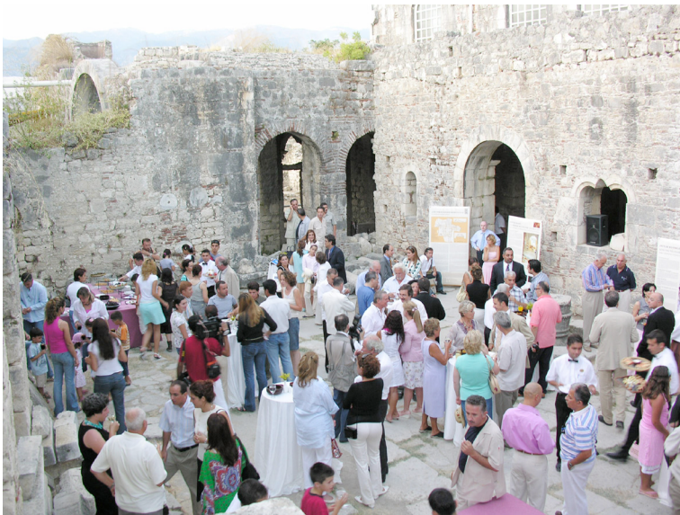
Reception, West Courtyard of Church